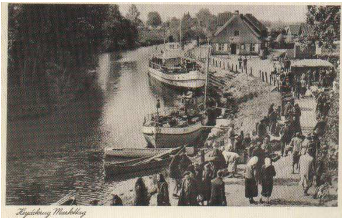
Pav. 4. Tradicinis Šyšos upės krantinių formavimas.