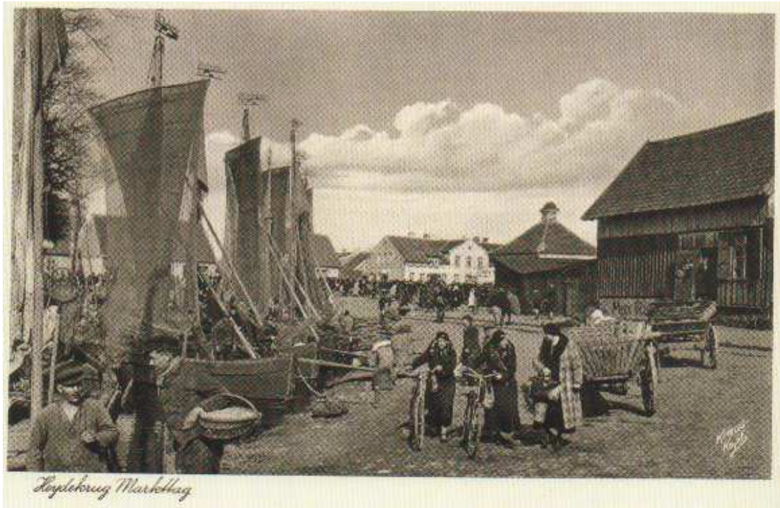
Pav. 3. Istorinė aikščių bruko danga, buvę statiniai, laivų siluetai.