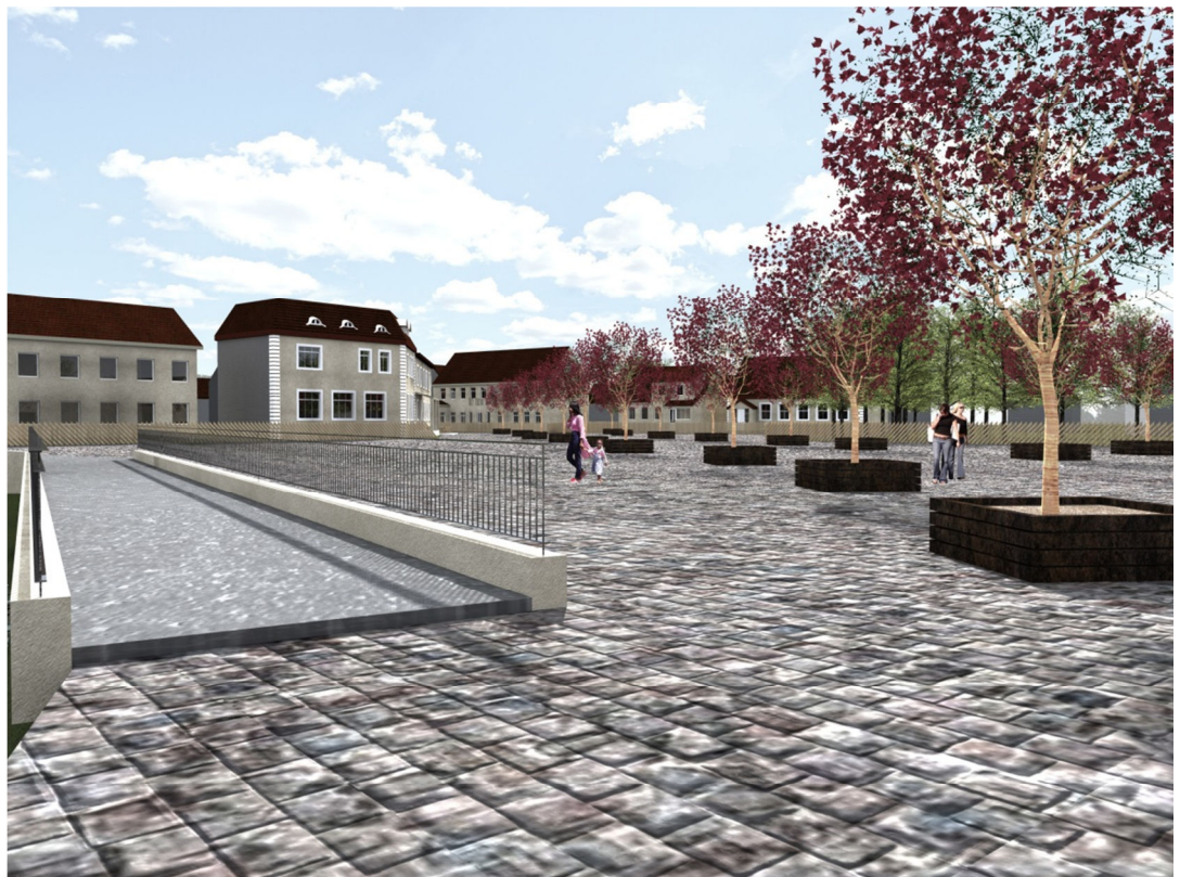
Žuvies turgaus aikštė