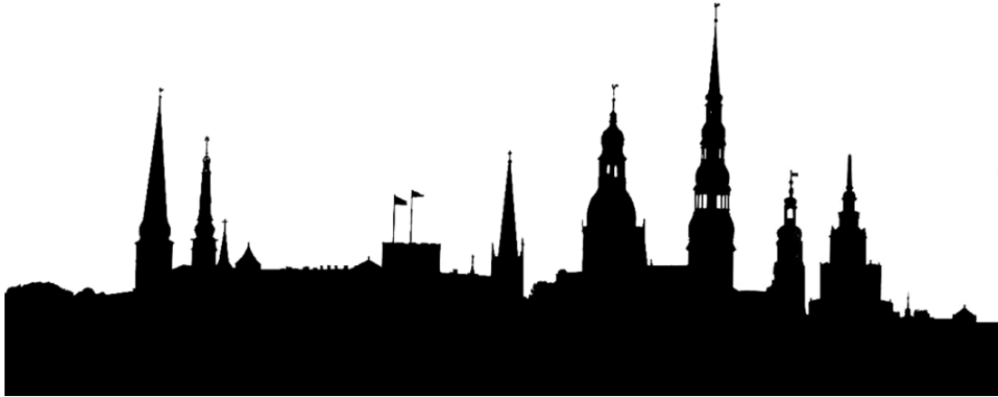
Pasirinktas Rygos silueto fragmentas

Klaipėdos siluetas. Skirtingų miestų siluetų derinimas yra neatsitiktinis: iš vienos pusės nesitraukiama nuo Mažosios Lietuvos regiono uostamiesčių charakterio, iš kitos – siekiama panašaus efekto, kaip garsiojoje Château de Chambord, kur iš įvairių laikotarpių pasiskolinti bokštai sukūrė lyg ir miražą, fantastinio miesto siluetą. Konkursiniame projekte jungėme tiek geografiškai, tiek istoriškai nutolusius objektus, taip sukuriant svajonių miesto siluetinę kompoziciją.